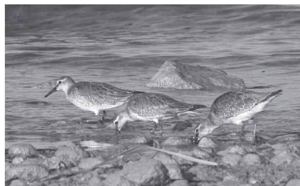
Giovani di Piovanello maggiore Calidris canutus fotografati il 12 settembre 2007 a Punta Grò sul basso lago di Garda.

Amazzone fronteggiata Amazona ochrocephala : un individuo di questa specie di origine neotropica di sicura provenienza aufuga, è stato osservato per diversi giorni nell'ottobre 2009 nei dintorni della parrocchia principale di Montirone (G. Garzetti).