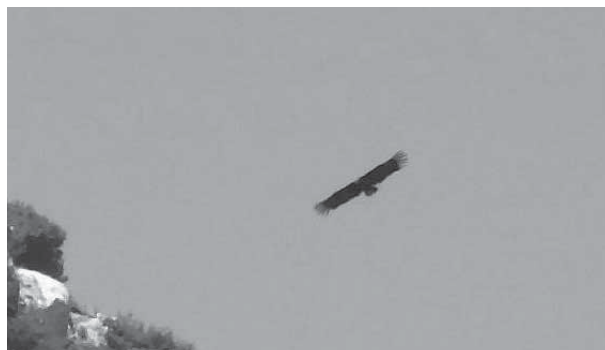
Avvoltoio monaco Aegypius monachus fotografato a Cima Còmer il 23 maggio 2009.