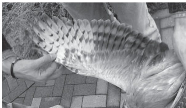
Albanella pallida Circus macrourus , individuo ferito il 13 novembre 2008 presso Calvagese della riviera.