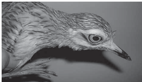
Occhione Burhinus oedipnemos individuo ferito il 30 luglio 2009.