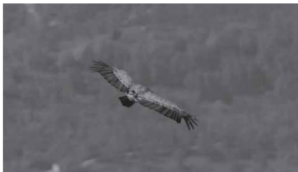
Immatero al 4° anno di Grifone Gyps fulvus fotografato a Cima Còmer il 4 maggio 2008.