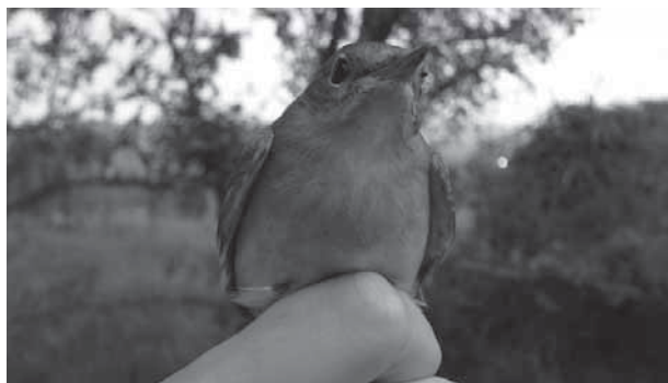
Usignolo maggiore Luscinia luscinia inanellato e fotografato presso Castrezzato il 19 aprile 2009 (foto R. Leo).