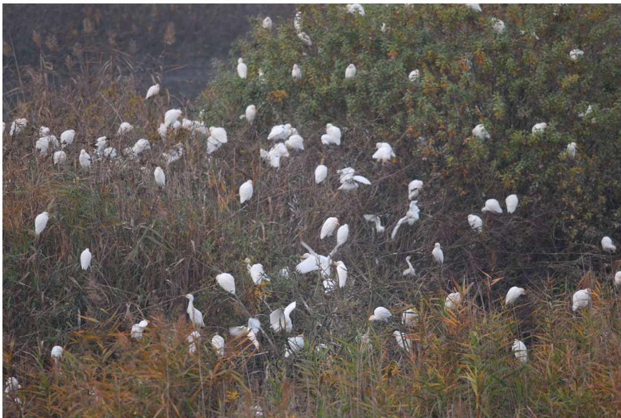
Roost di Aironi guardabuoi a Parco S.Lorenzo ( MN1101), gennaio 2010