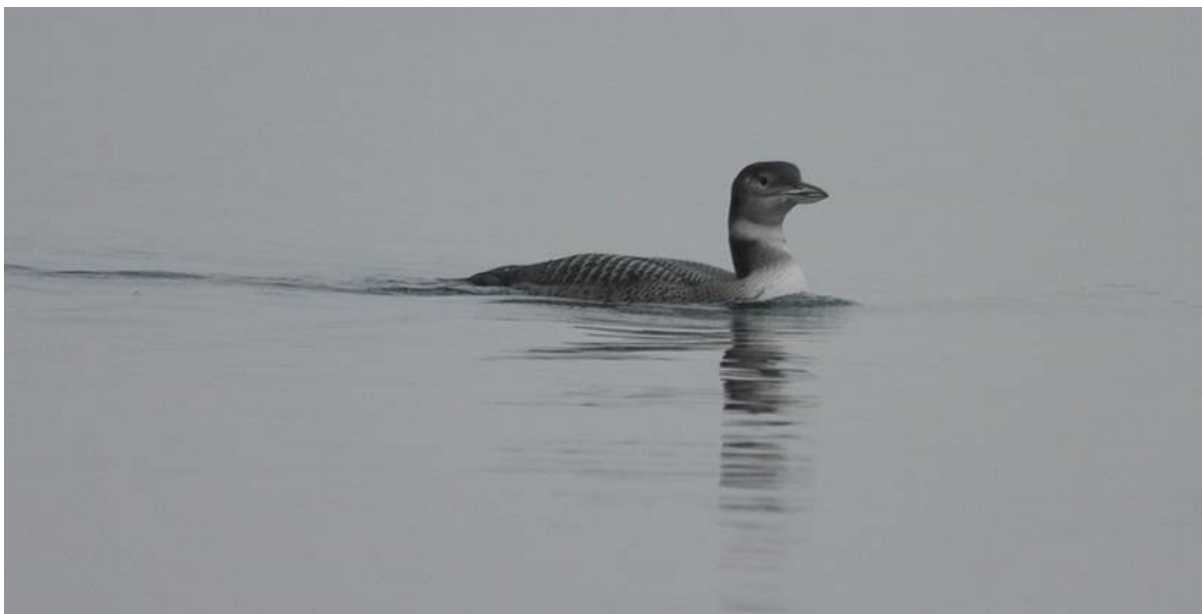
Strolaga maggiore osservata sul Basso Lago di Garda (BS0103), gennaio 2010.